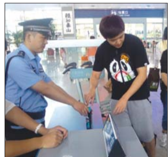
高铁泰安站民警查获违禁品。

均可报名申请资助(被军校录取以及其他免学费专业的除外)。资助活动坚持公开、公正、公平的原则,按照入户调查、审核、审批层层审核把关,接受社会监督,确保将资助金用于最困难的高考特困新生。按照不重复资助的原则,凡经其他渠道已资助的,本次不再纳入资助范围。