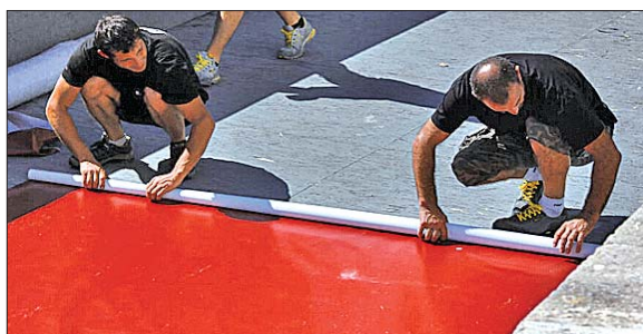
工作人员在赶铺红地毯。