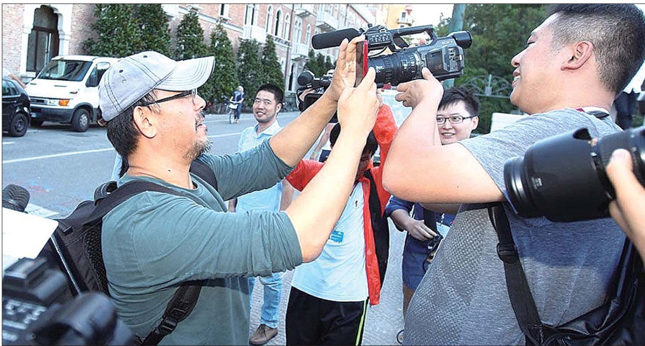
威尼斯电影节评委姜文和记者互拍。

当地时间8月28日,第70届威尼斯国际电影节拉开帷幕。在11天的时间里,这座古老的水城将因来自全世界的影人和媒体而焕发无比的活力。不过,如果指望在威尼斯“数星星”恐怕你是来错了地方,与往届众星云集丽都岛的盛大场面相比,本届威尼斯电影节显得有点星光暗淡。很多明星为了参加9月5日开幕的多伦多电影节而取消了威尼斯之行,这让有70年历史的威尼斯电影节略显尴尬。