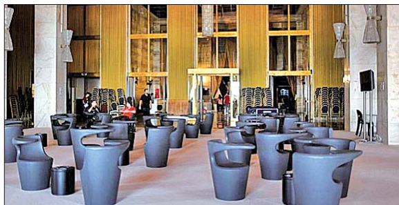
新闻媒体区,设计得很艺术。