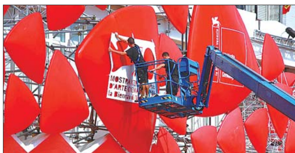
工人在张贴本届电影节海报。

本次威尼斯电影节主竞赛单元20部入围电影中,英语片占9部之多。英国导演非常活跃,特瑞·吉列姆继《帕那索斯博士的奇幻秀》后宣告归来,新片《零点定理》又是一部反乌托邦式的电影,克里斯托弗·瓦尔兹、马特·达蒙、本·威士肖、蒂尔达·斯文顿组成的阵容很是抢眼;乔纳森·格雷泽继《重生》后,时隔9年再战水城,《皮囊之下》描绘一名外星人利用美艳外表诱捕人类的故事,斯嘉丽·约翰逊饰演迷倒众生的外星人;斯蒂芬·弗雷斯的《菲洛梅娜》讲述朱迪·丹奇饰演的母亲用50多年时间寻找孩子的故事,弗雷斯的《女王》曾将海伦·米伦捧上威尼斯影后宝