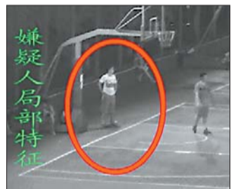
监控拍下的嫌疑人。