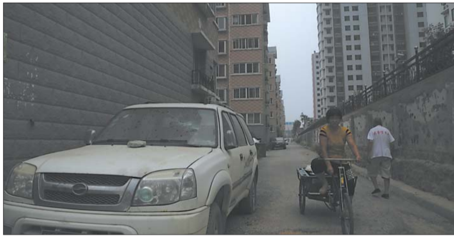
白车占据了小区主干道的半边。

本报96706热线消息(记者 张亚楠)“路本来就很窄,还一停停俩月,太不像话了。”舜亿佳园不少业主很无奈。两个多月前,一辆SUV停在主干道一侧,一直不动。原来车主因为工作一直呆在北京。