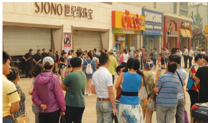
世纪缘上次直销会,数万市民排队抢购,这次在本报举办“钻戒厂价直销会”,预计人更多。

对于市民担心的钻戒被买光,抢不到的问题,组委会主任介绍,这次直销会做了充足的货源准备,确保让多数市民最低能以市场价30%的价格买到,让所有打算购买钻戒的市民都能实现钻石梦。