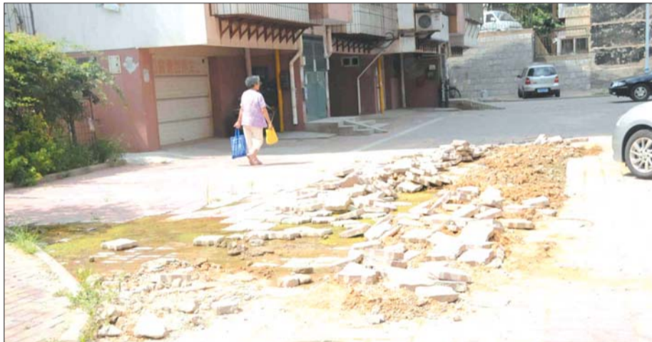
28日,记者在小区看到,地砖凌乱地堆在地上。

曲先生介绍说,这段路面裸露着,一到下雨天,泥浆水流得到处都是。最让曲先生担心的还是老人和孩子的安全问题