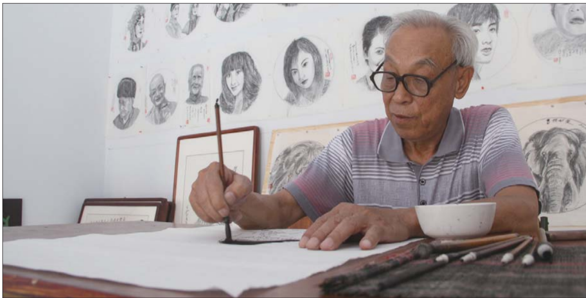
文/片 本报记者 赵树行 谭正正