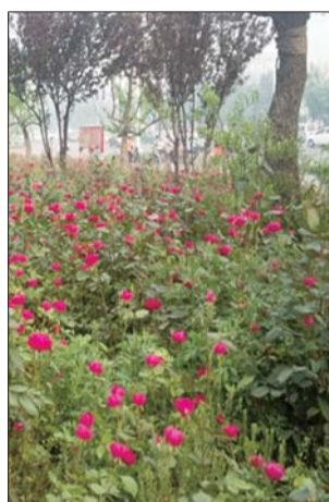
▲张店新村路上的月季。