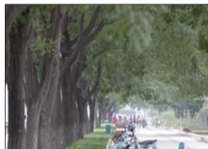
▲张店柳泉路上的国槐。

张店人民西路两侧郁郁葱葱的法桐是淄博市区一道美丽的风景。市树市花是城市的一张生态名片,咱们淄博也有市树市花了。28日,市十四届人大常委会第十四次会议审议通过了关于命名淄博市树市花的议案,确定国槐、法桐为市树,月季为市花。