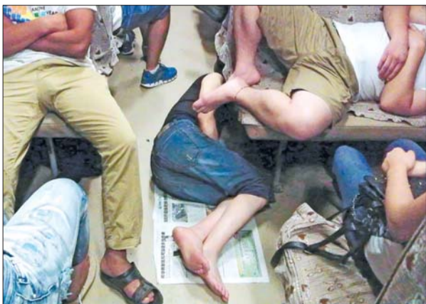
▲困倦到极限,无处可当床。