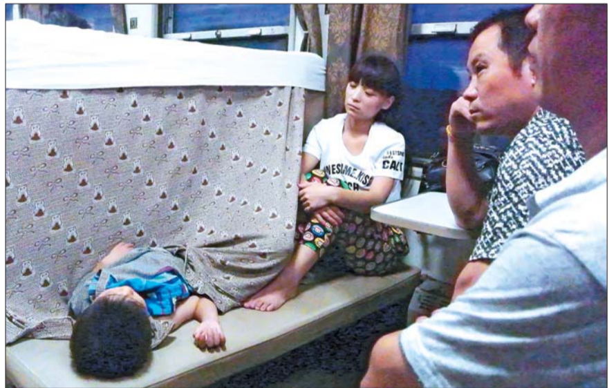
▲给孩子留出尽可能大的空。