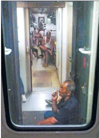
▲老式车厢的连接处设有吸烟处,一名老人默默地抽着烟。

更多精彩图片见齐鲁晚报拍客网 http://zt.qlwb.com.cn/paike/ 未经本报许可,严禁转载拍客图片!