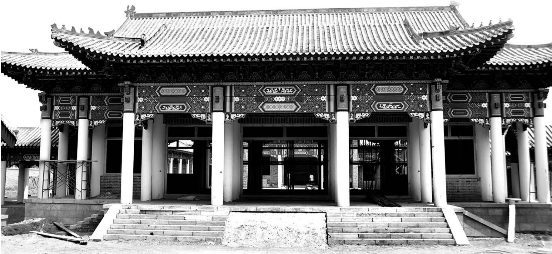
座落在老城区楼西大街上的七贤堂(资料片)。