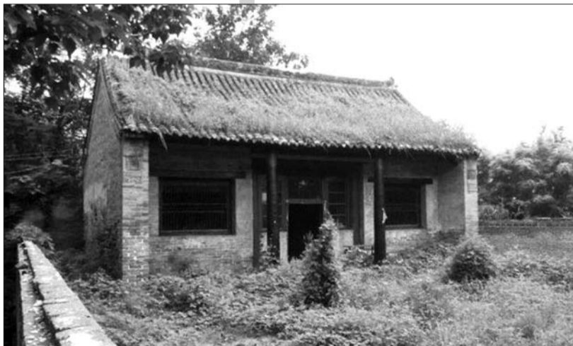
王汝训家庙。