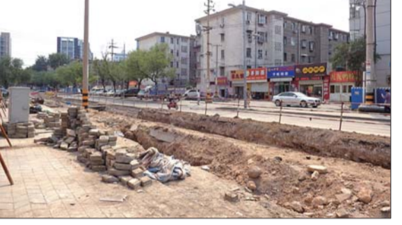
花园路路口,山大路北段仍在施工。

1日下午2时许,在花园路与山大路交叉口,道路东侧被施工围挡封闭,留出西侧六七米宽的道路通行。