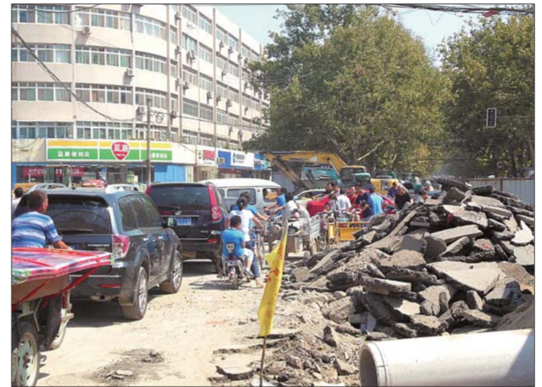
▲幸福街和济齐路路口因施工拥堵十分严重。 ◀机场路一大桥施工致使道路限行。

目前仍没完工。”不过目前,该路段西侧已经整修完毕,“东侧路基也铺设完成,马上就会铺沥青。9月初将实现双侧快车道临时通行,9月底全面完成。”