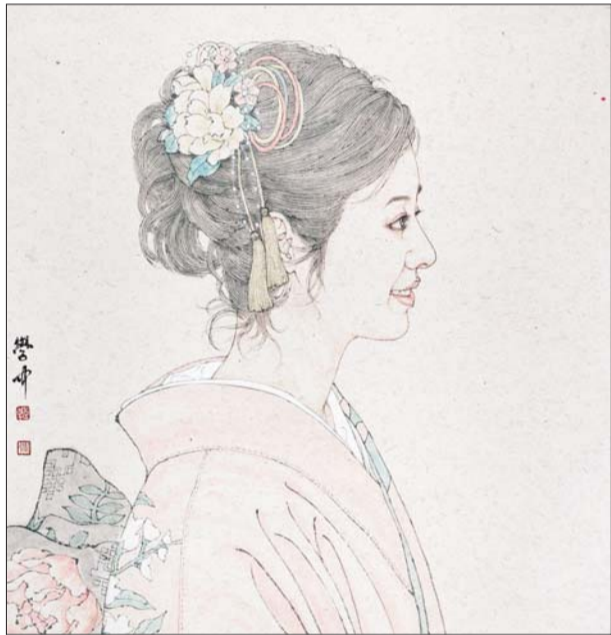
▲线描头像之一 68x68cm 韩学中

马素贞与绘画结缘,始于改革开放初期。当时,许多专业画家主动迈进媒体的大门,这为当时担任《大众日报》文教部编辑的她提供了接触和学习交友的好机会。受到画家们的影响,她忙里偷闲,开始不断临摹、创作,为其绘画打下了良好的基础。此外,她还自修了中国画函授大学的美术专业教材,在学习和实践中不断探索,将自己的情感注入其中,使画面富有耐人寻味的意