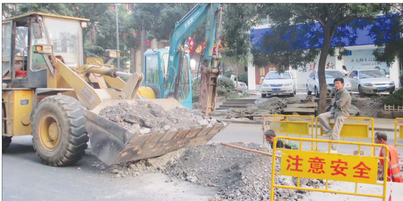
和平路供水管道试压冲洗时发现一处漏水,工作人员正在整修。

本报9月5日讯(记者 蒋龙龙) 5日,记者从济南水务集团获悉,长达3公里的和平路供水管道改造工程已接近尾声。供水管道由300毫米口径的铸铁管改成500毫米的球墨铸铁管。改造后,和平路沿线的供水将更加稳定。 和平路沿线居民小区、企事业单位较多,和平路所使用的供水管道为300毫米口径的铸铁管道,已经铺了20多年。目前老管