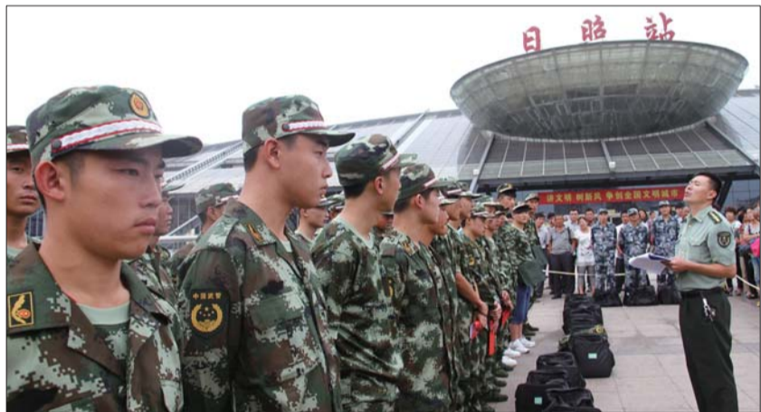
集合完毕,新兵们就要踏上人生新的征程。