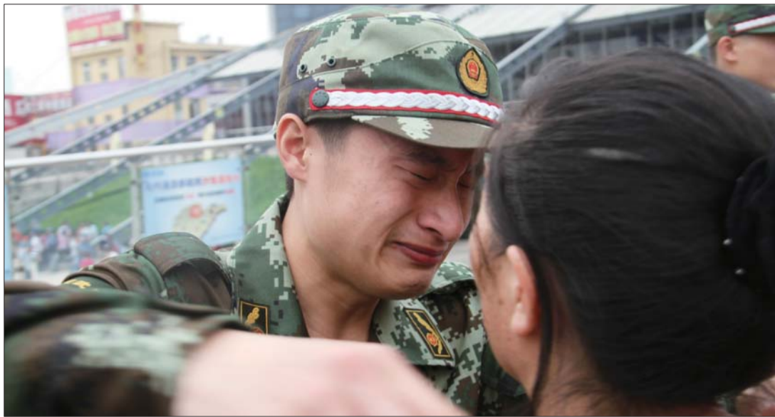
就要离别,与母亲深情拥抱。