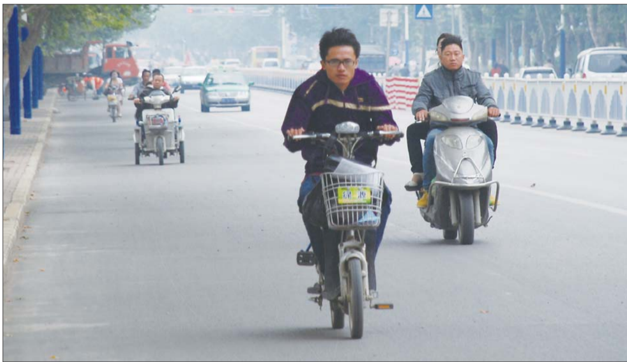
5日早晨气温较低,不少市民穿上了外套御寒。

本报枣庄9月5日讯(通讯员 褚涛 记者 赵艳虹) 4日夜一次弱冷空气过程,5日让市民出门不知该添多少衣服。最近一段时间,枣庄市天气状况良好,一天中的温度能够相差近10℃。未来枣庄的天气依然秋意十足,出现较大温差的天气还将持续,早出晚归的市民注意多备件衣服。 最近一段时间,天气有了浓浓秋意,早上出门是凉风习习,到了中午阳光强烈即使穿T恤还是会感觉炎热,最高气温