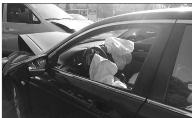
虽然本田车上的两个安全气囊打开了,但驾驶员依然受了伤。

交警赶到现场后,把本田轿车的驾驶员从车里抬了出来,此时大家才闻到驾驶员身上一股浓浓的酒味,而且意识