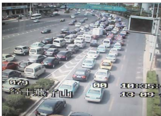
13日上午10点半,交警指挥大厅显示,燕子山路口车流量相对较大。本报记者 吴金彪 翻拍