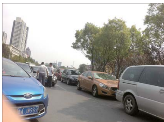
13日上午,燕山立交西下桥口附近车流量大,两辆车刮擦挡了路。