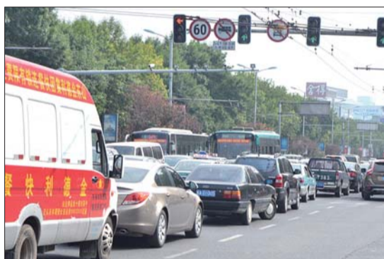
13日上午10点左右,车辆堵住泺源大街跨突泉南路路口。

此外,由于受中央严禁公款送礼等政策影响,外地车牌数量较往年有所下降,不过也有一些外地“送礼”车辆因不熟悉路况违章被查。