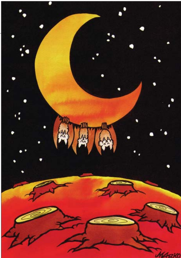
栖身之地 雷蒙斯(秘鲁)