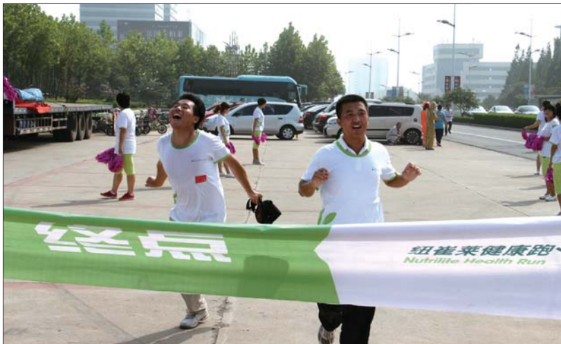
活动参与者终点撞线。