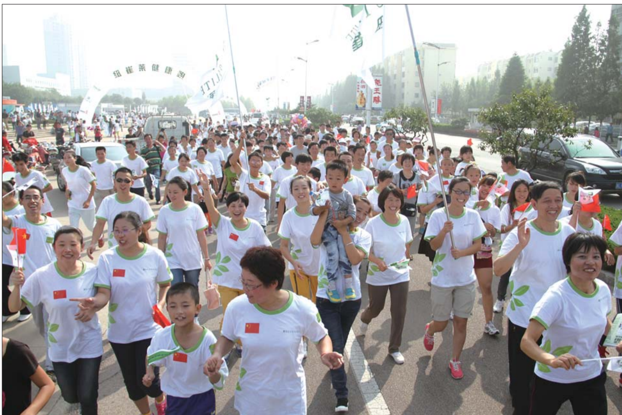
安利纽崔莱健身跑活动吸引了众多参与者。