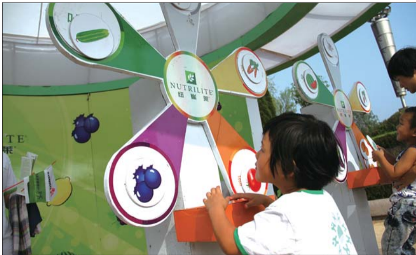
活动现场,小朋友们在做游戏。