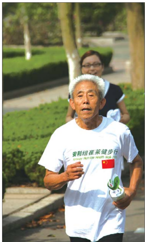
一名花甲老人也参与到健康跑活动中。