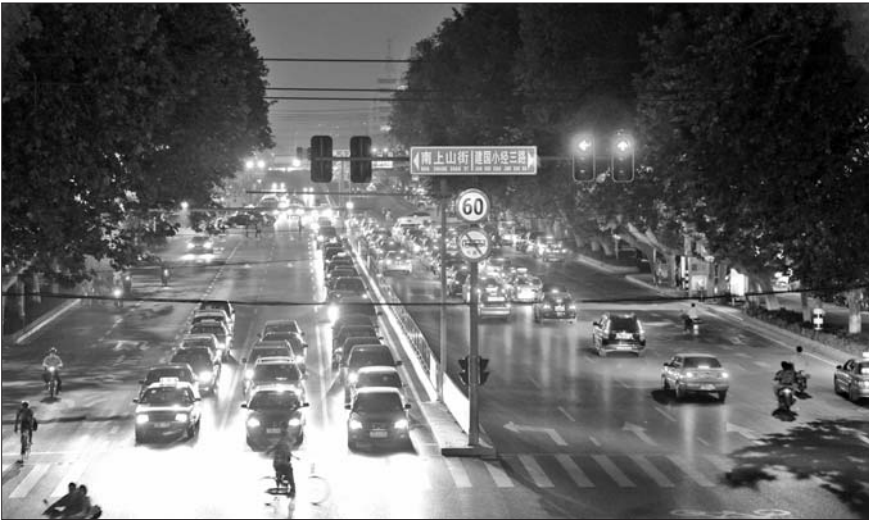
16日18时40分左右,济南市纬二路并没有出现明显的堵车现象。

本报济南9月16日讯(记者董钊) 16日,距中秋节假期还有三天时间,济南市路口通行状况保持平稳,尽管在早晚高峰出现短时拥堵状况,但外地车数量没有像往年一样明显增加。 从近几天的交通流量来看,济南市的交通状况较为平稳,并没有像往年一样出现大面积、长时间的拥堵。 “现在,一个信号灯基本能放行90辆机动车,在高峰期,机动车一般能在两个信号灯内通过路口。”济南市历下交警大队冻源中队中队长刘金亮说,这种状况和平常没有太大差别,而在往年同期,外地车的涌入较为明显,能占到三成,现在并没有看到类似情况。 交警部门有关人士分析,往年外地车在节前纷纷来济,主要以购物和走访为主,如今在中央、省、市各级的规定下,走访活动已经明显减少,这反映到路面上就是拥堵状况有所降低。 来自济南交警的统计,15日济南市的报堵次数为62次,16日的报堵次数为90余次,这样的数量与平常相比略有升高,但与往年同期比已经明显下降。 交警部门预计,随着节日临近,市民会友、探亲、购物、出游等活动将更加频繁,在17日、18日两天,交通压力很可能增大。预计中秋节期间交通流量增幅将在10%到30%之间。