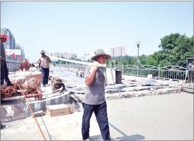
施工人员正在紧张施工。

桥面主体工程已经铺设完毕,双层钢筋搭建的桥面平均厚度达到20厘米左右。铺设完的桥面上已经蒙起了塑料薄膜,等待硬化。桥梁两边的过渡路段将在17日完工。整体路面经过15天的硬化龄期后,才能实现通车。 “这次桥梁的维护不仅仅局限在路面上,整个桥体都要进行修整。”项目负责人说,目前,洸府河桥底面全部粘贴了碳纤维布,使整体结构受力更加科学,提高了桥梁的抗弯、抗拉强度。为了保障行人安全,桥上原有的人行道地砖将全部换成防滑砖,桥底面的橡胶支座将全部更换,对所有桥桩将进一步加固。