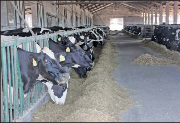
在威海嘉盛乳业有限公司的生态牧场,工作人员介绍8月份持续高温天气使奶牛产奶量减少20%左右。

此类活动,“都不够卖了,还促销啥。” 在大型超市内,品牌液态奶提高身价,但在一些便利店、小超市则出现缺货现象。在新威路和纪念路等多家便利商店内,伊利、蒙牛高端品牌牛奶已经“销声匿迹”。 对于牛奶涨价现象,不少消费者感到摸不着头脑,“怎么突然就涨价了,关键是喝牛奶已经习惯了,就算是涨价我们也只能被动接受,不能因为涨了几元钱,全家人就不喝牛奶了。”市民孙先生说。