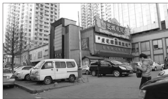
位于青岛繁华商业区的新艺城夜总会。

上世纪90年代, 青岛兴起一股开设游戏厅的风潮, 聂磊也开设游戏厅、赌场、夜总会等灰色行业, 所处地区正是当时任一线警务工作的于国铭、冯越欣等人的巡查范畴, 聂磊便