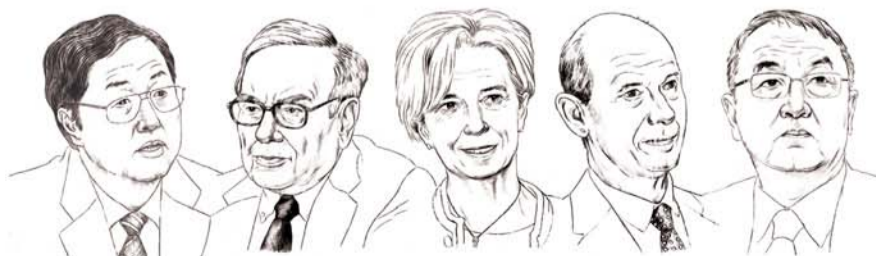
中国央行行长周小川 全球股神巴菲特 IMF总裁拉加德 WTO总干事拉米 联想控股董事长柳传志 记者杨燕青 2013年7月专访 记者冯郁青 2013年5月专访 记者冯迪凡 2011年6月专访 记者郭丽琴 2010年9月专访 记者赵楠 2012年12月专访

The Leading Financial and Business Newspaper in China