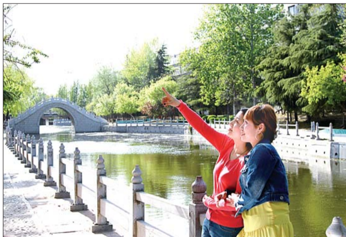
兖州城区优美的环境。