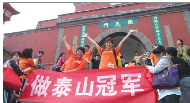
诚之旅接待泰山冠军活动现场照片。