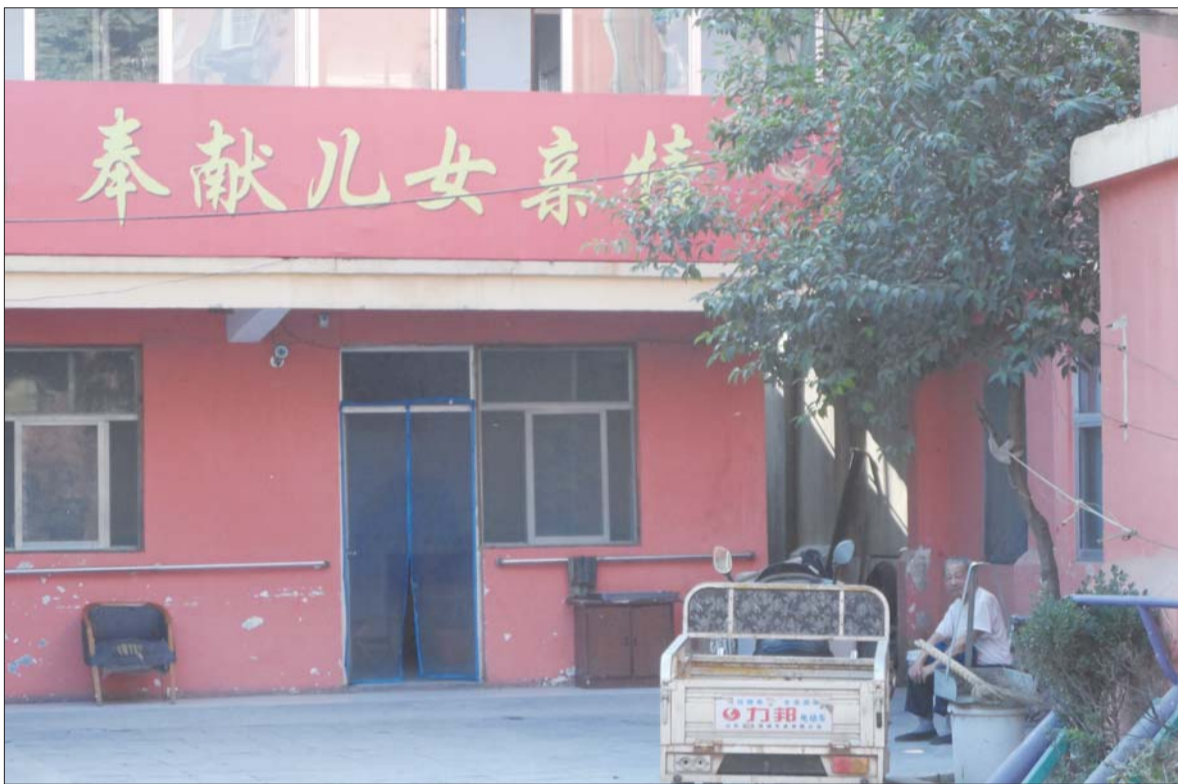
大文老年公寓里,老人们大都在屋里看电视,韩大爷一人独自坐在屋外。