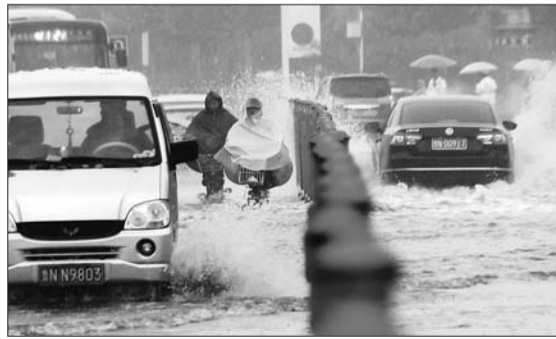
21日突降大雨,德州天衢路上,市民通过积水路段。

23日是农历二十四节气的“秋分”,“秋分”节气的到来意味着冷空气开始活跃,气温降低的速度也开始变快。连下几天小雨,接上一场冷空气,对我们的身体和精神状态都是一次小测验,尤其是老年人和体弱多病者,饮食要规律、清淡,加强身体锻炼,保持心情乐观。此外,天凉了,背心、短裤基本上可以收起来了,换上长袖、保暖点儿的衣服,以防着凉吧。