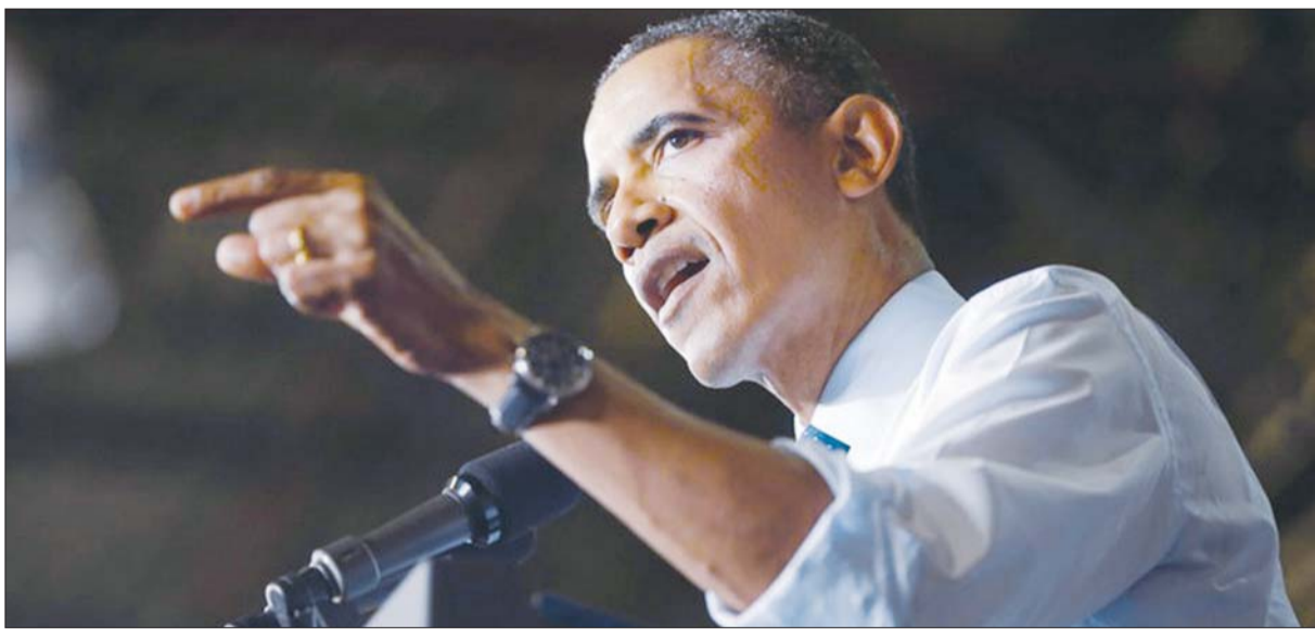
20日,奥巴马斥责共和党“把整个国家挟持为人质”。