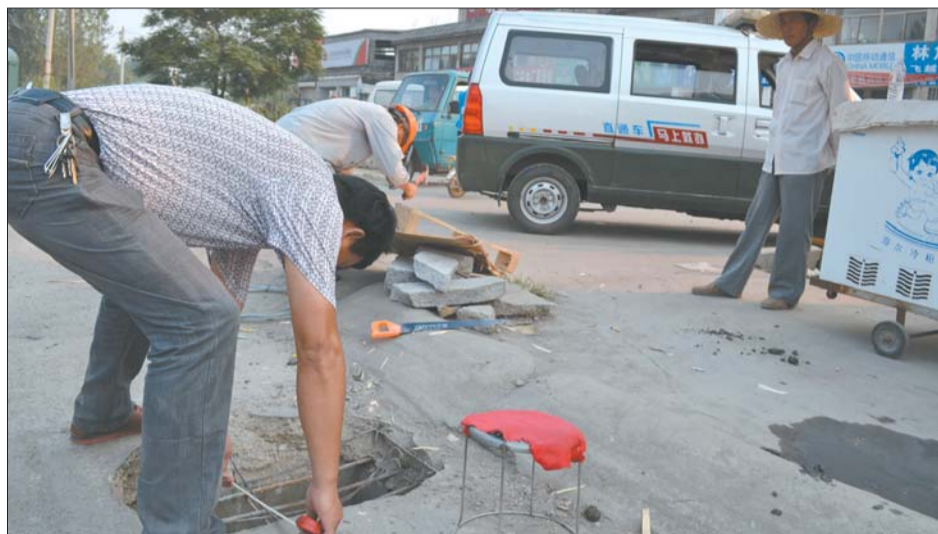
9月3日,王先生拨打马上就办热线后,交通局工作人员当日便来到他家门口修好了破损井盖。

“不是我们想当然地为群众做什么,而是群众决定要我们做什么。”提出这一想法的曲阜市委书记李长胜说,“我们的工作就应由群众提出,由群众交办,让群众监督,让群众评判。”