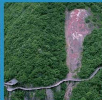
天脊龙门 4A 级旅游景区