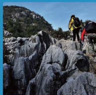
三衢石林 4A 级旅游景区