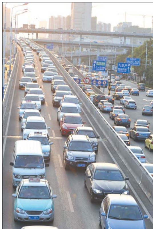
假期临近,市区大主干道又出现了拥堵。

在时段上,从10月1日起,每日7时至9时交通流量预计明显下降,每日9时以后交通流量将明显上升,12时至14时交通流量将恢复平稳,14时至18时将再次迎来交通高峰,18时后逐渐回落。