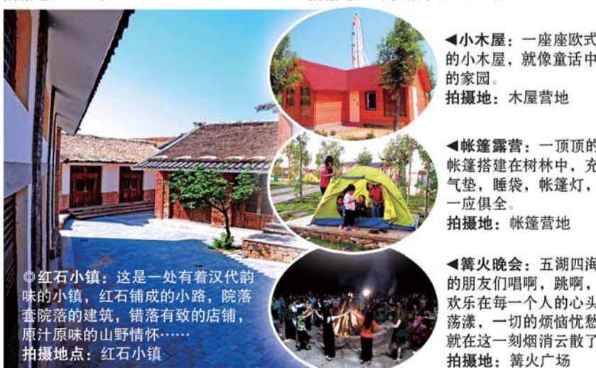
▲小木屋:一座座欧式的小木屋,就像童话中的家园。拍摄地:木屋营地