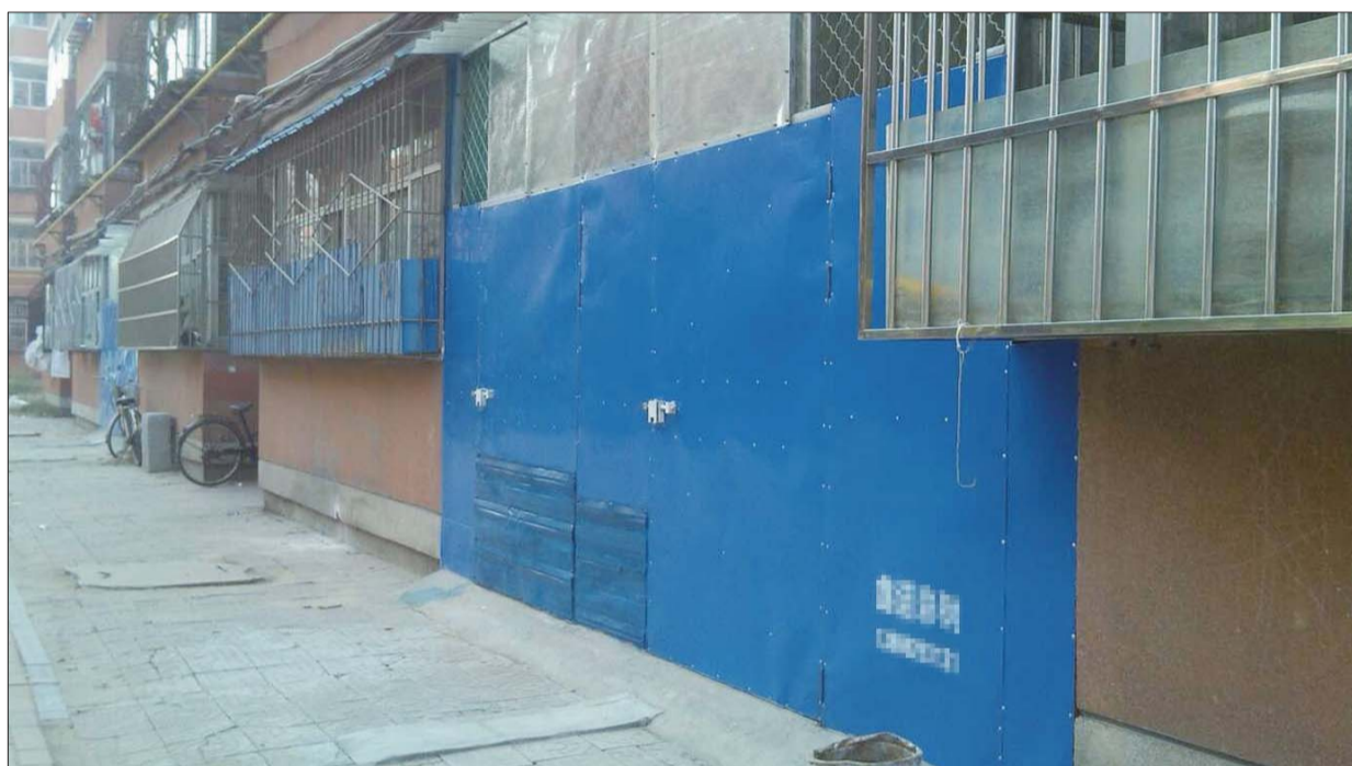
在铁路小区,在两个阳台间的空隙中私自搭建的房屋。

据了解,分配的房源为齐河县永祥小区多层住宅楼,户型为二室一厅,共90套。按照分配方案要求,廉租住房分配申报家庭分为四种类型。各类型分别分为A组、B组。分配仪式当日,90户低收入家庭均按照抽取的顺序号依次选取自己想要租住的楼房。