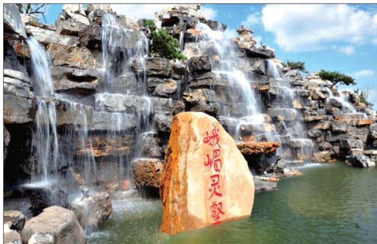
霞披桃花山