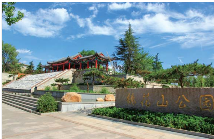
桃花山新貌