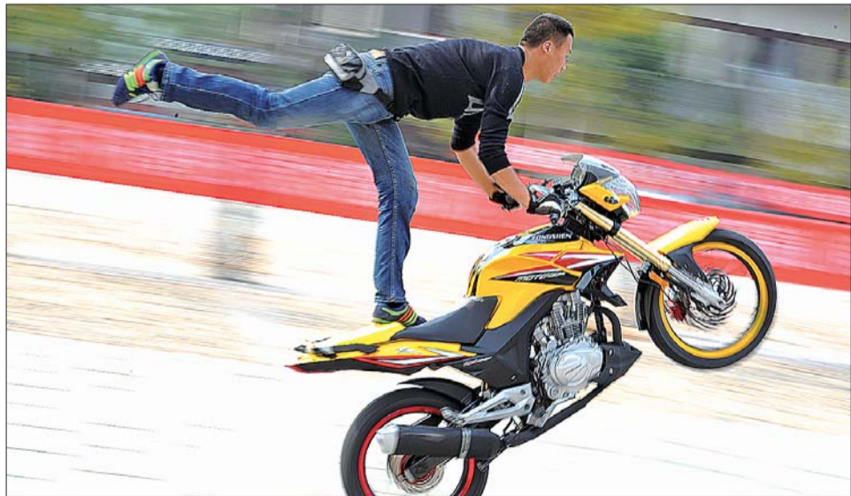
10月1日,山东首届蒙山(龟蒙)“宗申杯”摩托车漂移大赛暨摩托车特技表演赛在临沂蒙山龟蒙景区举行,比赛吸引了来自全国各地的200余名摩托车选手前来一决高下,此次赛事共进行7天。据悉,摩托车漂移大赛在国内尚属首次举办,参赛选手精湛的车技令众多游客大饱眼福。

打韩国之前,中国已经三战全胜获得了世锦赛参赛资格,但是再次面对韩国队,郎平和队员们只想着赢球。本场比赛郎平使用了全主力出战,直接以3:0横扫韩国,韩国队无缘2014年世锦赛,哈萨克斯坦获得出线名额。