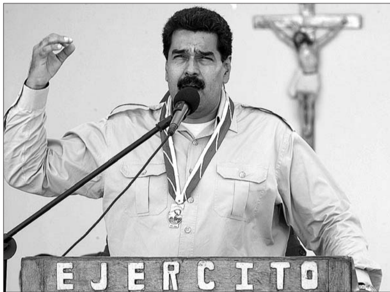
9月30日,委总统马杜罗对部队发表讲话,其间宣布驱逐3名美国外交官。