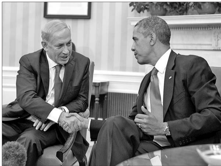
9月30日,美国总统奥巴马(右)在白宫会见以色列总理内塔尼亚胡。