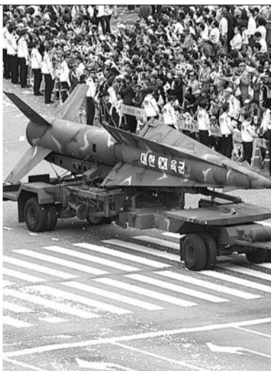
10月1日,韩国总统朴槿惠检阅部队(左图),军事装备亮相首尔街头(右图)。