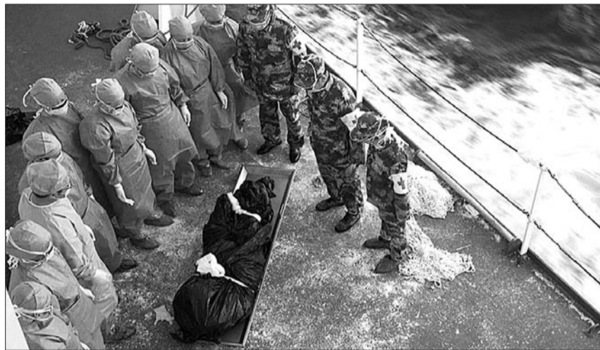
4日,中国海军和平方舟医院船在西沙琛航岛附近打捞起一具遇难渔民遗体。

截至10月5日18时30分共捞起5具遗体,共搜救广东渔船渔民36人,其中生还26人,遇难10人,仍有52人失踪。