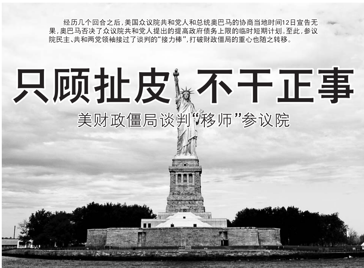
10月12日,美国纽约自由女神像重新开放,资金由州政府提供。

据新华社华盛顿10月12日电 美国总统奥巴马当地时间12日在每周例行广播讲话中说,众议院共和党人愿意避免债务违约的态度是“积极的”,但拖延解决债务上限问题的做法并不可取,而且也没有理由让政府关门的问题继续。