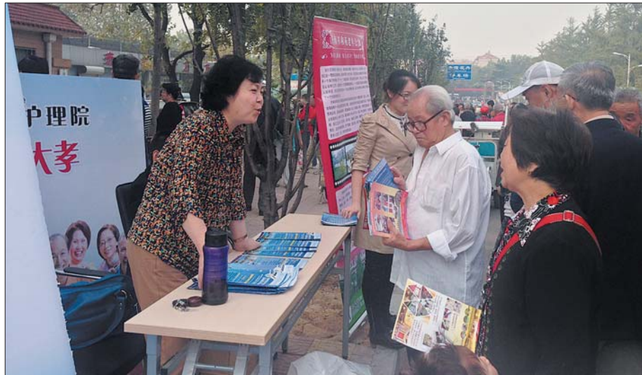
老年公寓宣传日活动吸引了不少老年人咨询。

据了解,近几年,济南市大批企业改制后,企业退休人员的管理都转入了街道社区,社区便成为老人活动的主要场所。社区合唱舞蹈队队员多是老年人,社区活动室也总能看到老人们