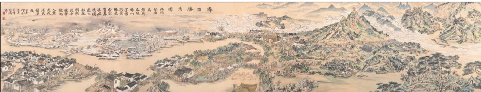
▲《济南胜景图》局部一