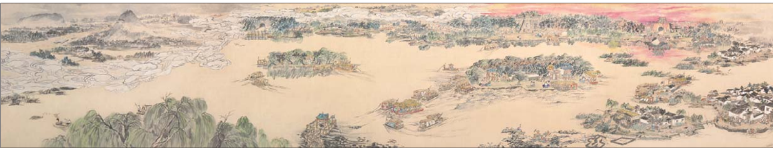
▲《济南胜景图》局部二