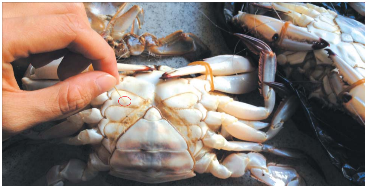
田女士说螃蟹上存在针眼大小的细孔,足有1厘米深。

本报10月13日讯(记者 杨薪薪) 13日,家住紫郡城的田女士带回家5只大螃蟹,就在她准备煮蟹子时发现,螃蟹的外壳上存在针眼大小的小孔,掰开后则发现一窝浑水,略带腐臭味,田女士怀疑自己遇到了注水螃蟹。