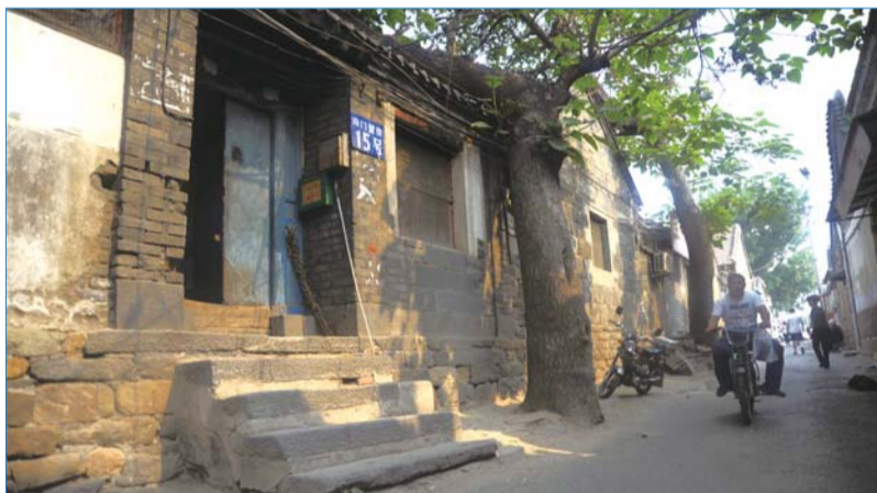
所城里的小巷散发着老烟台的古朴味儿。