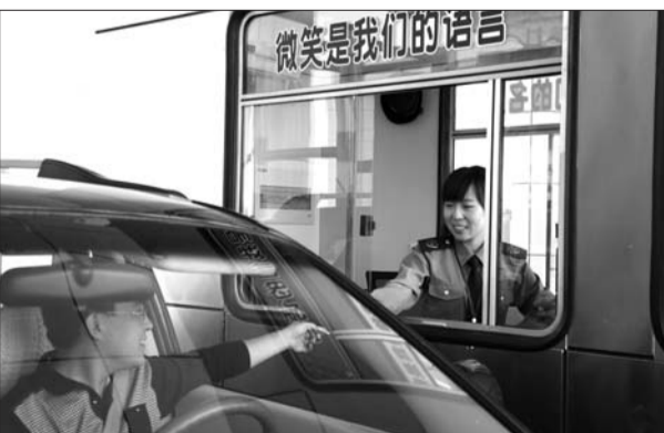
工作人员热情接待过往司机。

从日照到龙山收费站42公里,用不了半个小时时间,而下高速后可以直接通过刚修好的旅游大道,到莒县也在半个小时以内,整个行程比走335省道要节省半个小时左右时间。