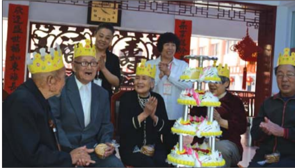
大家为老人们庆祝生日。

此外,上午9点多,新泰义工20多名志愿者来到龙廷镇敬老院,为老人打扫卫生、包饺子。上午10点半,由新泰市公益志愿者协会联合新泰市老年大学等单位主办的何李社区文艺汇演在青云街道何