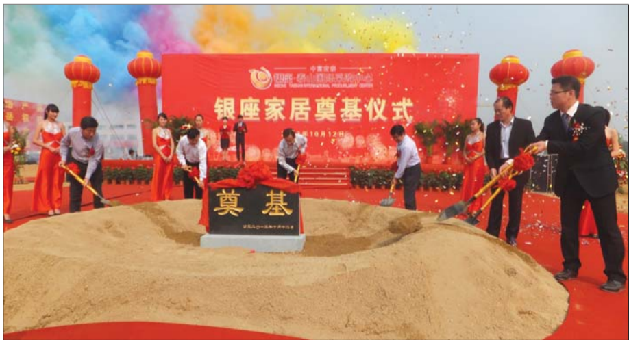
银座家居广场奠基典礼。

12日上午,在欢腾的隆隆礼炮声中,泰山国际采购中心银座家居广场开工奠基仪式隆重举行。岱岳区政府相关领导、中富兴泰置业有限公司全体员工、银座家居代表参加了仪式。