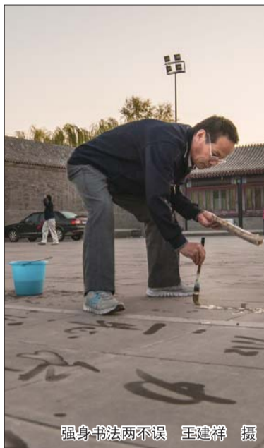
强身书法两不误