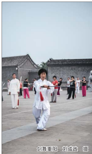
剑舞重阳 刘成政 摄