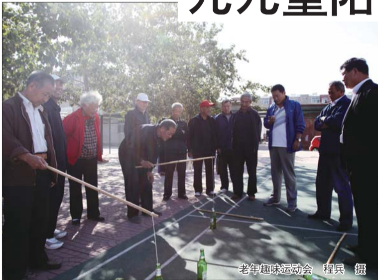
老年趣味运动会