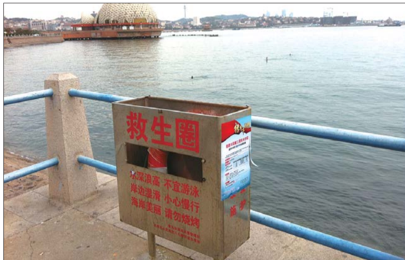
青岛八大峡海域救生箱的不锈钢盖子被人撬走。

在泰安的城乡接合部,刚安上的站牌过几天就不翼而飞。老泰莱路的33路站牌今年总共安了三次。“从年初到现在共丢了30多块铁制站牌。”工作人员说。