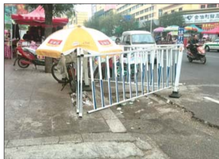
莱芜凤城西大街上被损坏的护栏。