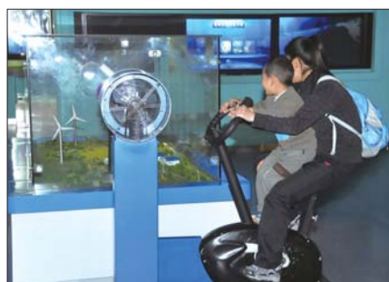
威海科技馆内一个只能坐一人的设施上坐上了两个人。