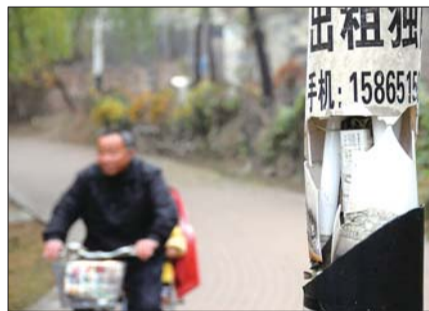
菏泽赵王河公园周边景观灯被破坏严重。