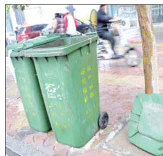
聊城东昌路上多个垃圾桶盖遭损坏。