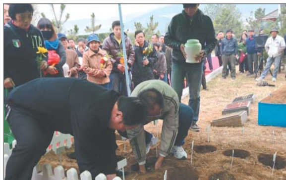
逝者家属将骨灰坛放入挖好的花穴中。

济南市民政局社会事务处相关负责人表示,近年来,国家倡导绿色环保的安葬方式,“但市民对这种新型的安葬方式还需要有个接受过程”,目前全市已经统计到的通过海葬、树葬、花坛葬等生态方式安葬的逝者,共约300位。“总数不大,但是近年来是越来越多了。”