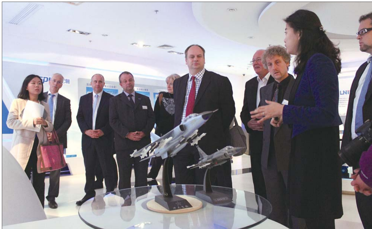
德累斯顿市议员和企业代表团参观创新园高科技产品。本报记者 修从涛 摄

德国萨克森州德累斯顿市被称为“欧洲硅谷”,是欧洲高新技术产业的聚集地,集中了一大批国际著名企业和世界尖端技术研发中心。近年来,中国经济的快速发展也引起了当地企业来华合作的兴趣。