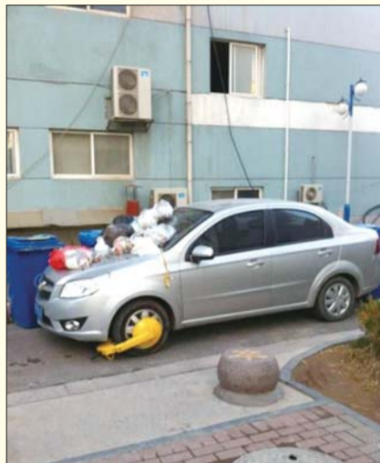
在小区里占道停车的后果。