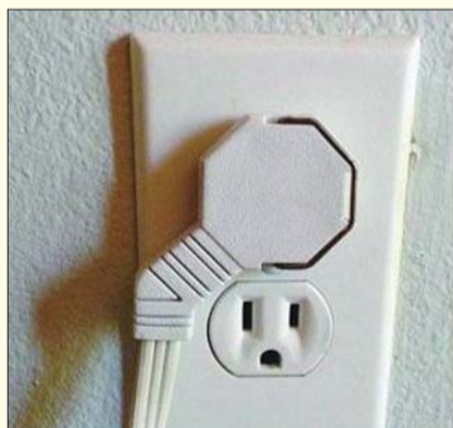
有的时候,聪明的设计让人觉得:啊,这才是业界良心。