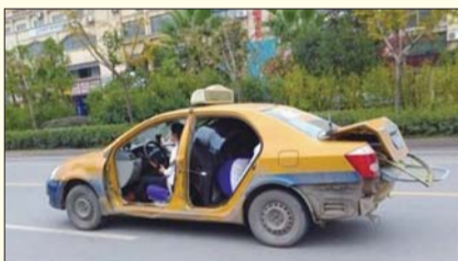
淡定姐啊,这是拿生命开玩笑!