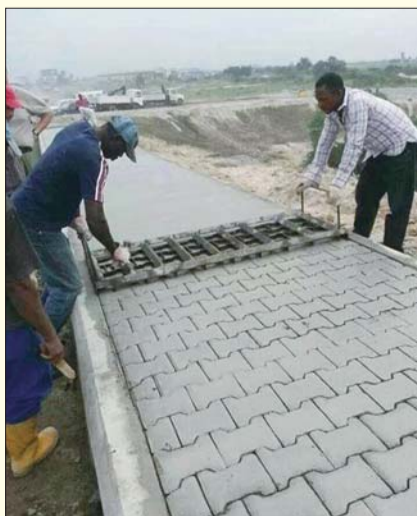
有的时候,智慧是一种偷懒的行为:啊,原来这才是真相。