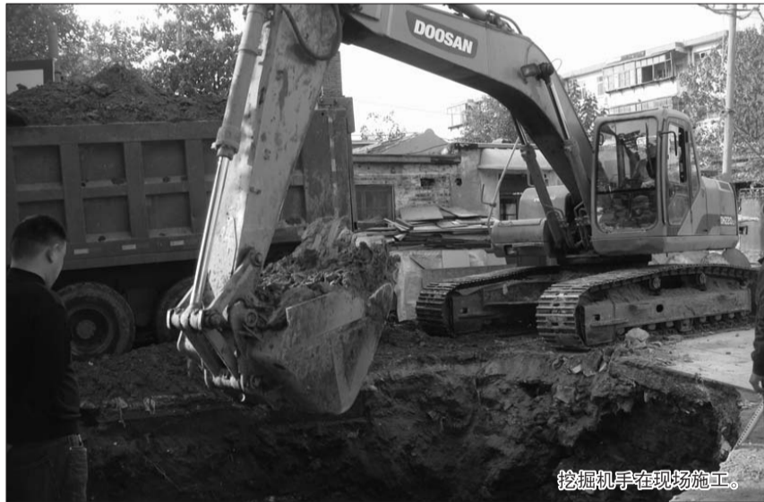
挖掘机手在现场施工。

道由于不能与月河路雨水管道实现连接,所以铺到健康街就停止了。为解决春鸢路雨水管道雨水的出路,便在铁路桥东北角建了一座临时雨水泵站进行提水,雨水提升后排入健康街雨水管道。这座雨水泵站原先只有一台每小时600立方米靠手动的小水泵,后来又增加了一台每小时1600立方米的大水泵,并且实现了水泵